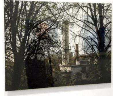
Les cheminées Série Fractal Spaces Tirage transparent sur miroir, 50 cm x 75 cm, 2014